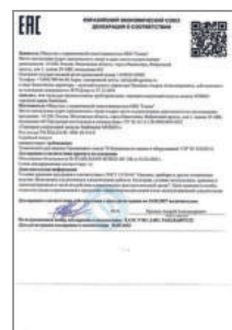
Декларация соответствия TR TC на терморегулирующий модуль Stahlmann MTR021