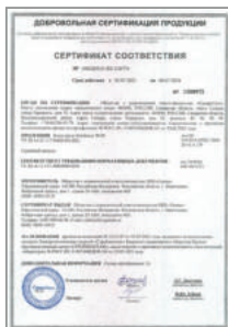
Сертификат соответствия на комплекты Stahlmann WHS