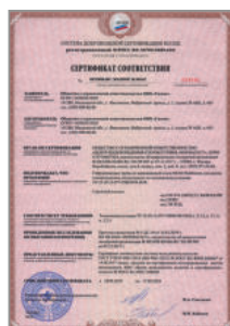
Сертификат соответствия Национального Пожарного Союза на гофротрубу Stahlmann