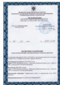
Санитарно-эпидемиологическое заключение на гофротрубу Stahlmann