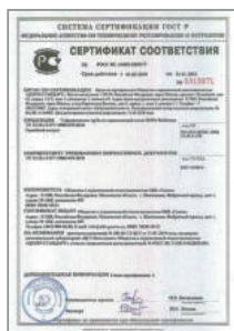
Сертификат соответствия на гофрированную трубу Stahlmann