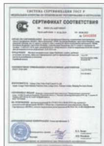
Сертификат соответствия на фитинги Stahlmann