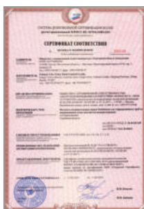
Сертификат соответствия Национального Пожарного Союза на фитинги Stahlmann