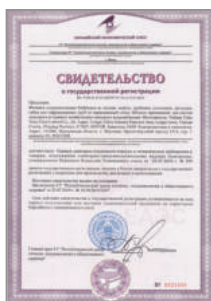
Свидетельство о государственной регистрации о соответствии продукции Единым санитарно-эпидемиологическим и гигиеническим нормам на фитинги соединительные Stahlmann